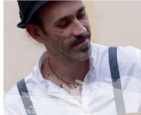
Guitarra 6 y 7 cuerdas, balalaika, bouzouki, baglamá saz, tambura, mandolina, voz.